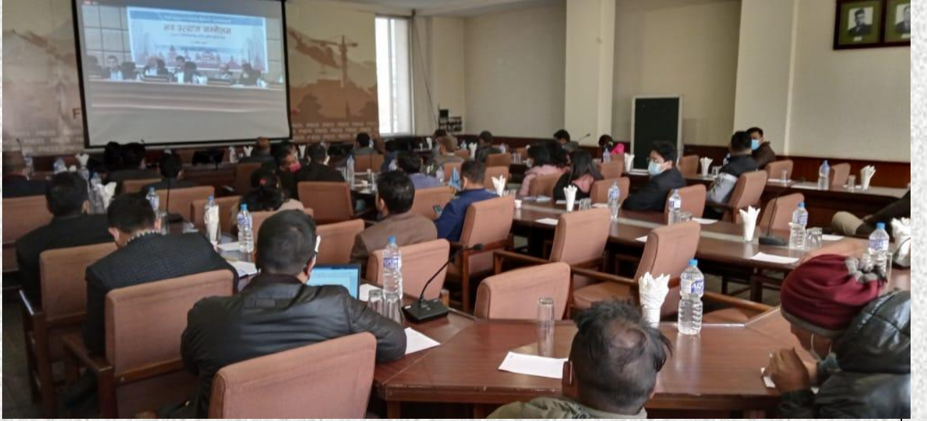
फेसबुक लाइभमार्फत अर्को हलमा उपस्थित सम्मेलनका सहभागीहरु