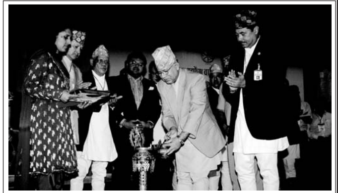
प्रधानमन्त्री नेपाल ४४औं वार्षिक साधारणसभा को समुदघाटन गर्नुहुँदै।

प्रधानमन्त्री नेपालले निजी क्षेत्रको प्रयास विकास र समृद्धिका सवालमा केन्द्रीत हुनुपर्नेमा जोड दिँदै उत्पत्तिको प्रमाणपत्रका विषयमा निजी क्षेत्रकै सहमतीमा समस्या