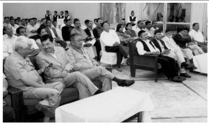
उद्यमी व्यवसायीसँग नेपाली कांग्रेसद्वारा आयोजित छलफल कार्यक्रम ।

कार्यक्रममा महासंघका पूर्व अध्यक्ष, सल्लाहकार समितिका सदस्यहरू, निवर्तमान अध्यक्ष, वरिष्ठ उपाध्यक्ष, उपाध्यक्षहरू, कार्यकारिणी समितिका सदस्यहरू र साधारण सभामा भाग लिन आउनु भएका उद्यमी व्यवसायीहरूको सहभागिता रहेको थियो ।