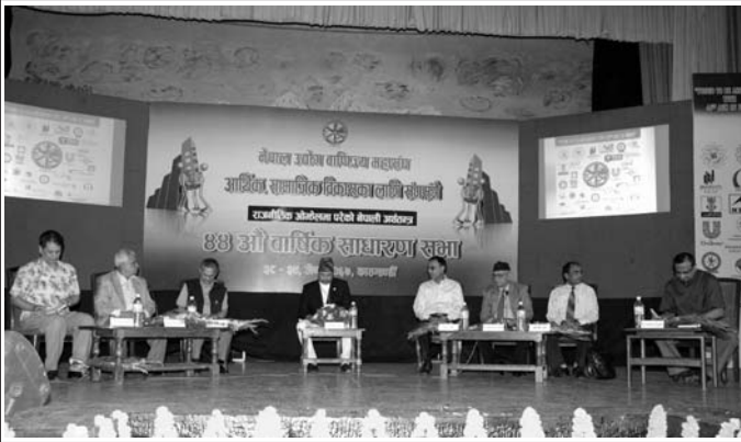
राजनीतिक ओभेलमा परेको नेपाली अर्थतन्त्र विषयक अन्तर्क्रिया ।

मुलुकका प्रमुख राजनीतिक दलका प्रमुख नेताहरूले यतिखेर आर्थिक क्षेत्रका संवेदनशील सूचकांकलाई मनन गरी अगाडी बढ्ने नसकेमा अर्थतन्त्र धरासायी हुने स्वीकार गर्नु भएको छ ।