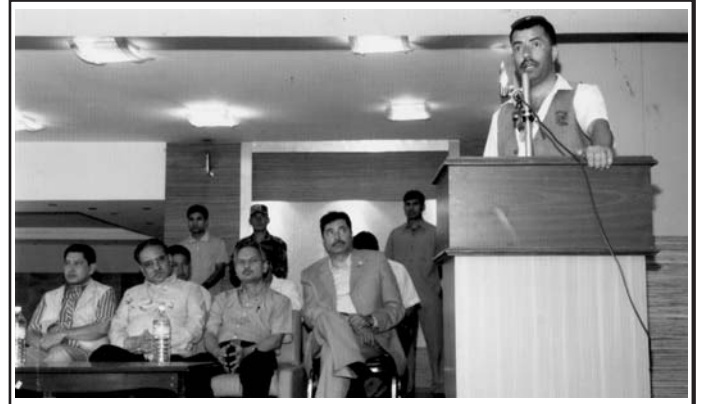
उद्यमी व्यवसायीसँग एनेकपा माओवादीद्वारा आयोजित छलफल कार्यक्रम ।

सो अवसरमा प्रधानमन्त्री नेपालले उत्पत्तिको प्रमाणपत्र विषयमा महासंघ लगायत यसका सदस्य संघ/संस्थाहरूबाट उठाइएका विभिन्न सुझाव एवं बहुद्वार प्रणालीबाट जारी गर्दा हुन सक्ने व्यवहारिक कठिनाई प्रति आफू पनि अनभिज्ञ नरहेकोले यस सम्बन्धमा चाडै समस्या समाधान गर्ने विश्वास दिलाउनु भयो । प्रधानमन्त्री नेपालले उद्यमी व्यवसायीहरूले राखेका