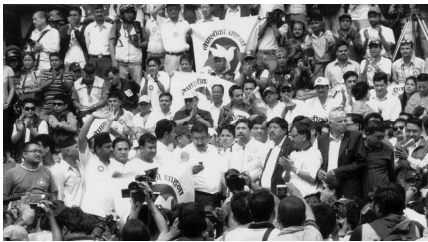
महासंघको नेतृत्वमा आयोजित शान्तिसभा।

राजनीतिक अवस्था तरल नै रहयो समयमा संविधान निर्माण हुन सकेन, संक्रमणकालिन अवस्था लम्बिन गयो, अस्तव्यस्त कायमै भयो भने राष्ट्रको आर्थिक अवस्था अत्यन्त नाजुक बन्दै