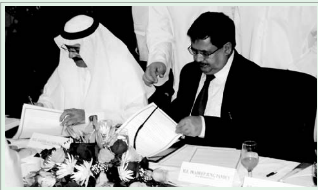
महासंघ र युएईउवामहासंघबीच सहमतीपत्रमा हस्ताक्षर गर्दै।

नेपाल र संयुक्त अरब इमिरेटस बीच निजी क्षेत्रका माध्यमबाट आर्थिक व्यावसायिक सम्बन्ध विस्तार, लगानी प्रवर्द्धन एवं थप नया सम्भाव्यताको